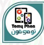
تومي فون للإنصالات