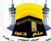
علم دعوة المكتب التعليمي للدعوة والإرشاد وتوعية الجاليات بالبرك