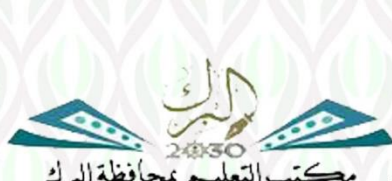
مكتب التعليم بمحافظة البرك EDUCATION OFFICE IN AL BERK GOVERNORATE