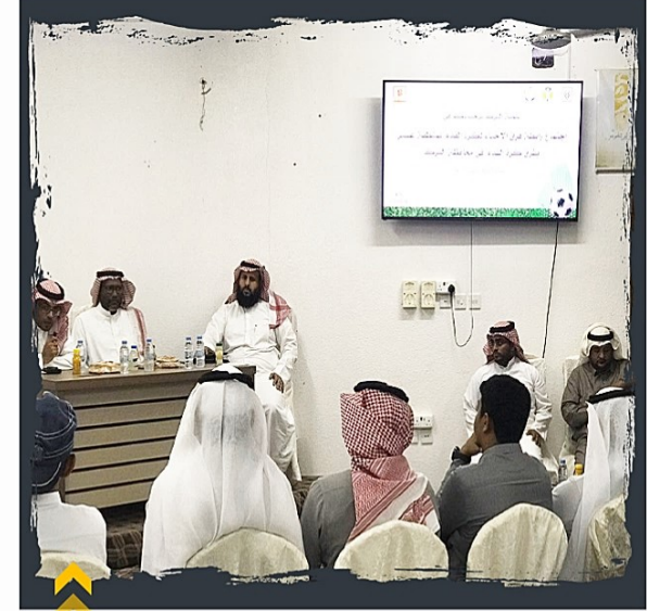
من استقبال رابطة فرق الأحياء بمنطقة عسير