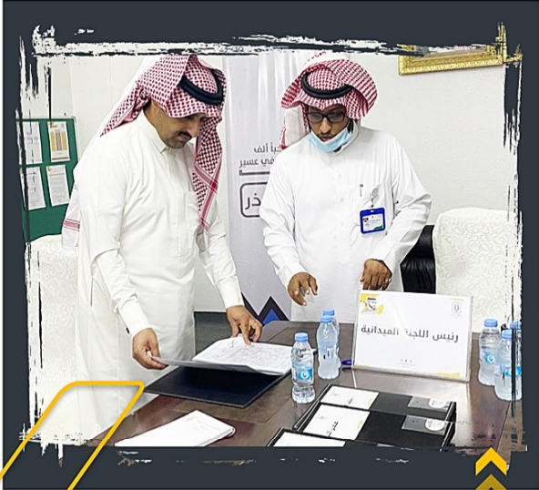
من زيارة سعادة رئيس بلدية البرك للجنة