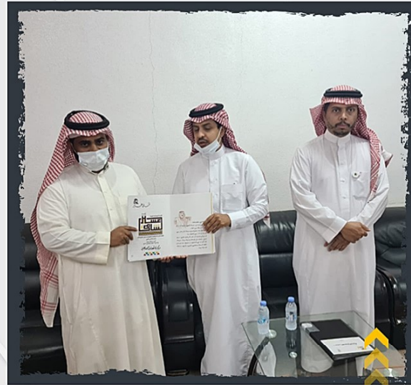
تكريم اللجنة بشهادتي تميز