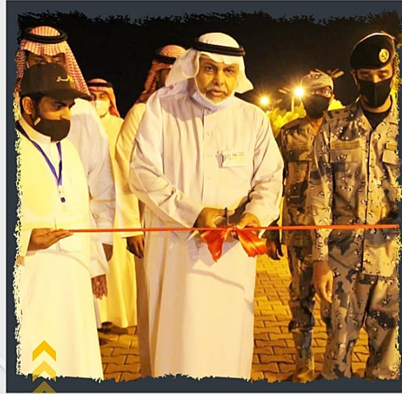
تدشين سعادة المحافظ لمر السعادة