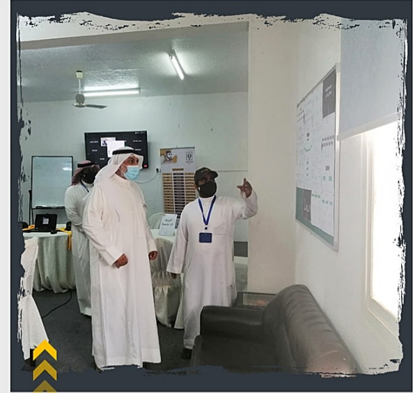
تدشين سعادة المحافظ لفرقة عمليات نشامى عسير