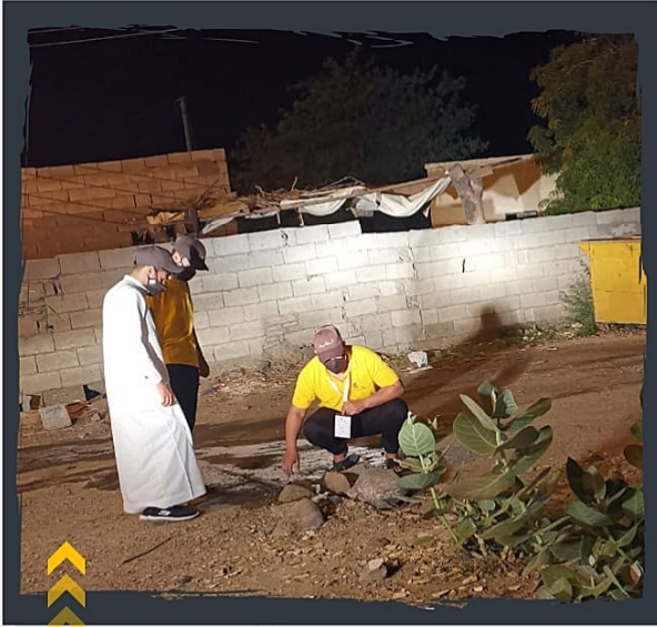
إصلاح تسريبات المياه بمركز ذهبان