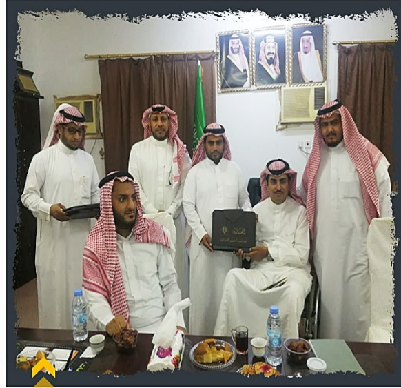
من استقبال فريق وقف إرادة لذوي الإعاقة