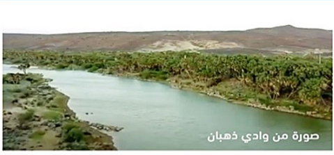
صورة من وادي ذهبان