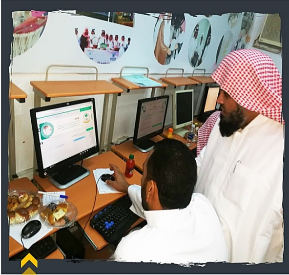
من استقبال منسوبي تحفيظ القرآن بالبرك