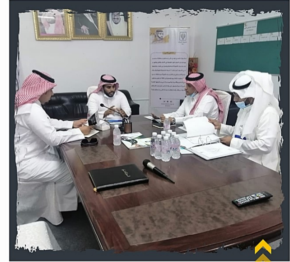
من زيارة بنك التنمية الاجتماعية بعسير للجنة