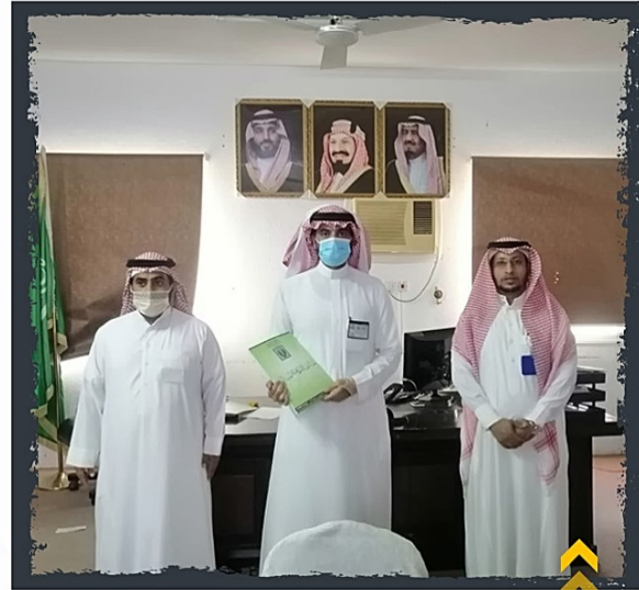
من زيارة المشرف العام على مراكز النمو