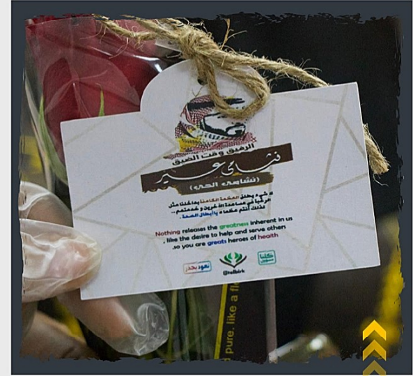
تكريم أبطال الصحة